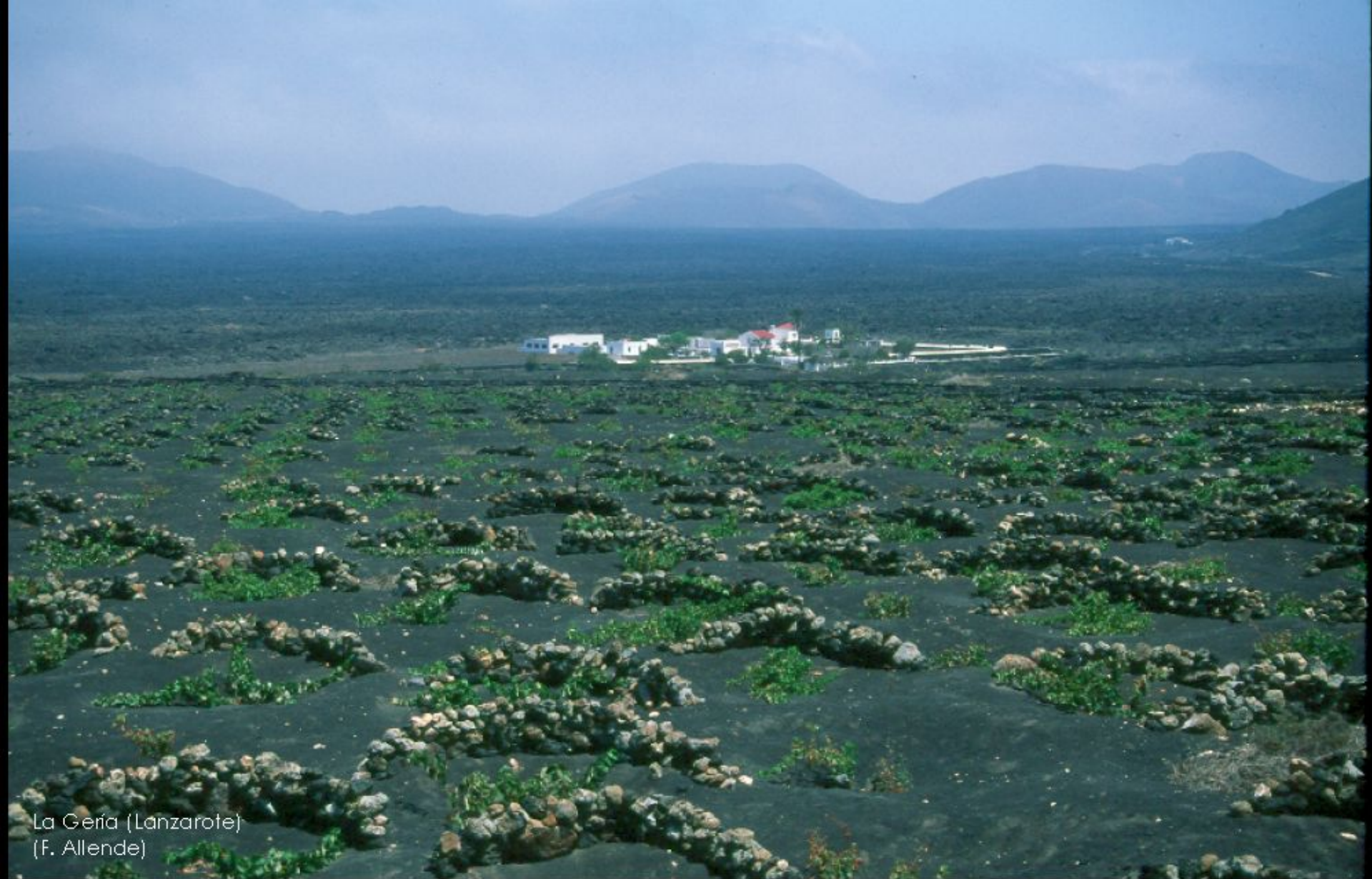
La Geria (Lanzarote) (F. Allende)

En las zonas medias y altas de las islas predomina la agricultura tradicional de secano orientada al consumo interno (cereal, vid, patata).